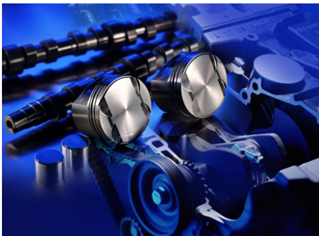
Funktionelle Beschichtung auf Motorkomponenten.

Durch DLC-Beschichtungen können die Lebensdauer und die Belastbarkeit gesteigert sowie Reibungsverluste minimiert werden. Das Fraunhofer IST hat maßgeblich an der Entwicklung von DLC-Schichten mitgearbeitet und beschäftigt sich intensiv mit der Anpassung verschiedenster DLC-Modifikationen an kundenspezifische Applikationen. Vor allem Kombinationen verschiedener Beschichtungen und Beschichtungstechnologien liegen im Fokus.